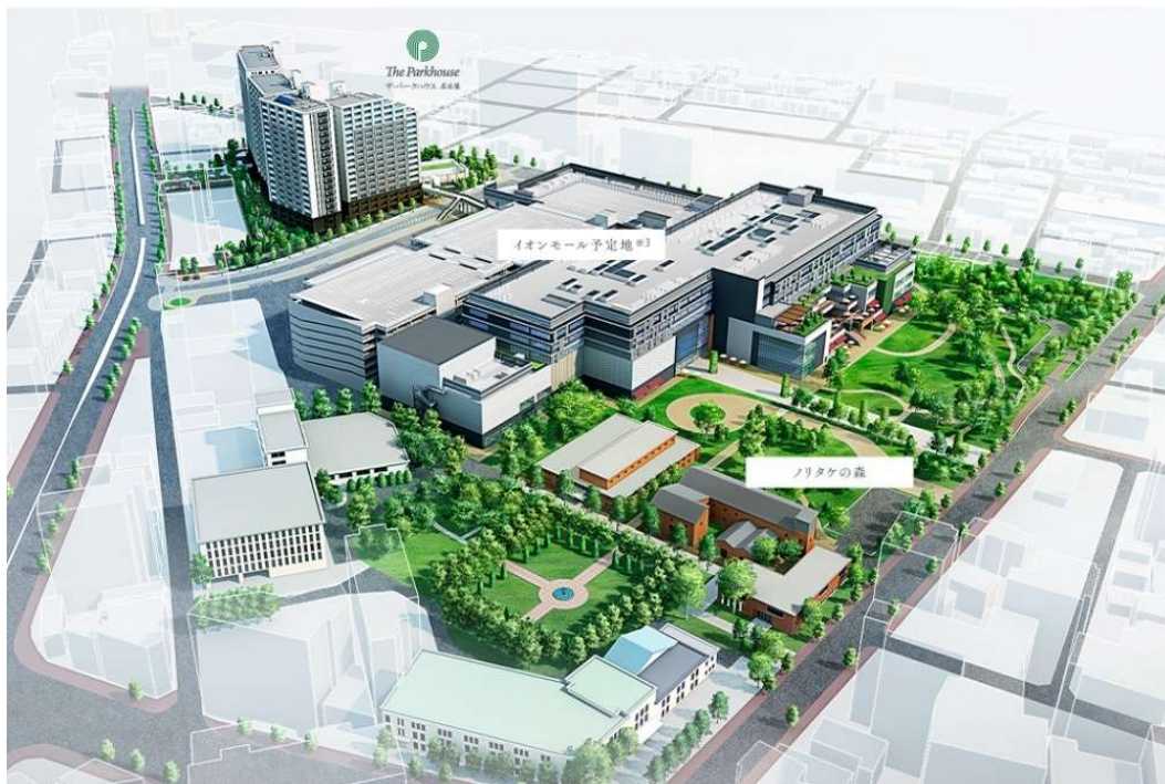
▲地区計画完成予想CG