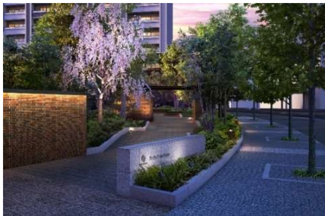
▲ゲートアベニュー完成予想 CG