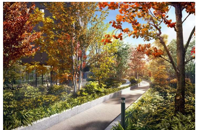
▲フォレストアベニュー完成予想 CG